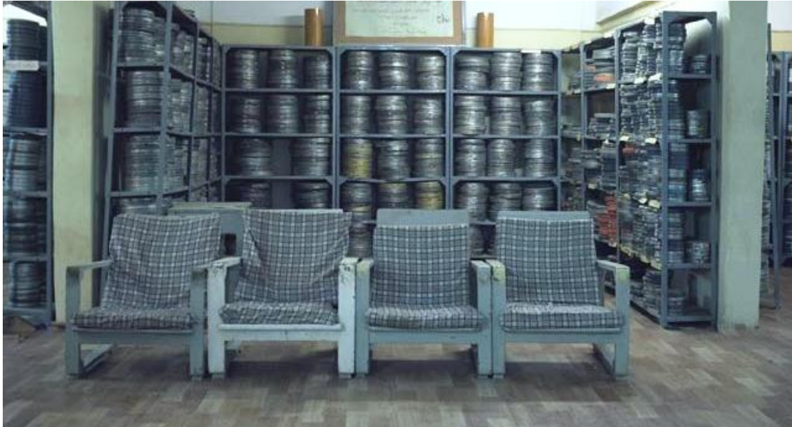
السينما في السودان – فريدريك سيفوينتيس